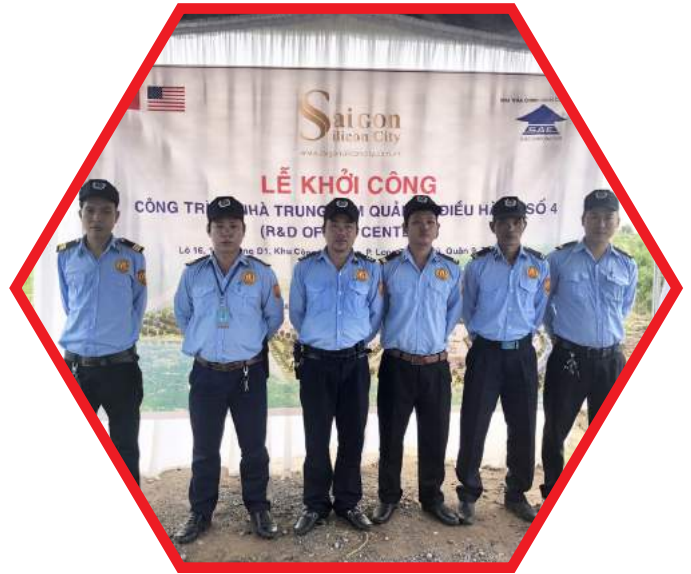
BẢO VỆ CÔNG TRÌNH XÂY DỰNG CONSTRUCTION PROTECTION