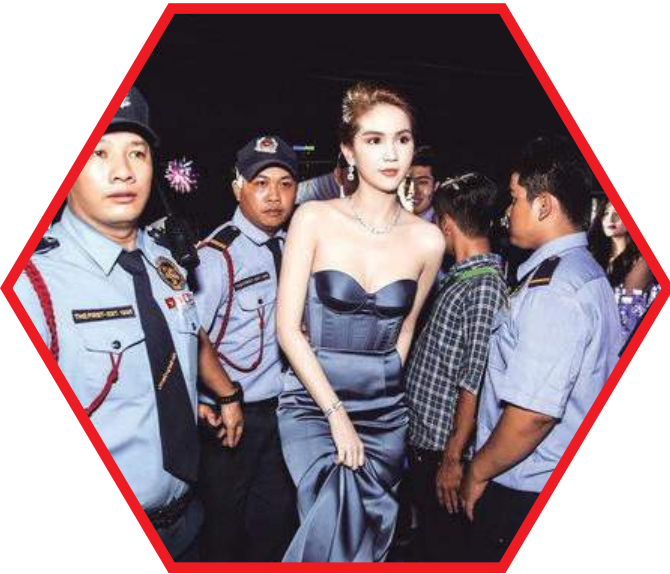
DỊCH VỤ VỆ SĨ YẾU NHÂN, CA SĨ BODYGUARD SERVICE, SINGER