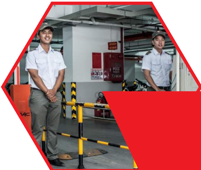
VẬN HÀNH VÀ KHAI THÁC BÃI XE TTMM OPERATION AND OPERATION OF THE COMMERCIAL CENTER