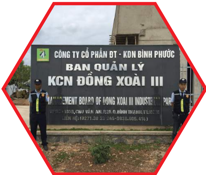
BẢO VỆ KHU CÔNG NGHIỆP, CỤM CÔNG NGHIỆP PROTECTION OF INDUSTRIAL PARKS AND INDUSTRIAL