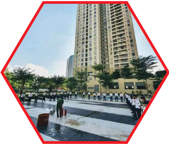
BẢO VỆ TÒA NHÀ, TRUNG TÂM THƯƠNG MẠI PROTECTION OF BUILDINGS, COMMERCIAL