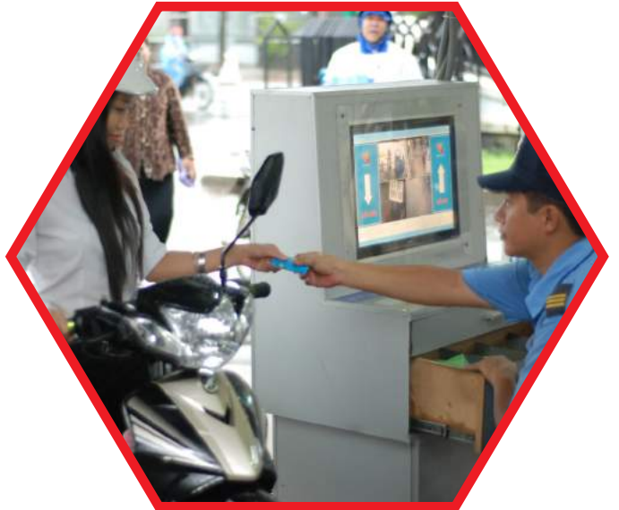
VẬN HÀNH VÀ KHAI THÁC BÃI XE BỆNH VIỆN OPERATING AND OPERATING HOSPITAL PARKING LOT