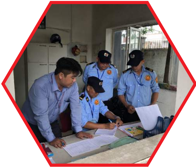
BẢO VỆ NHÀ MÁY, XÍ NGHIỆP FACTORY AND FACTORY PROTECTION