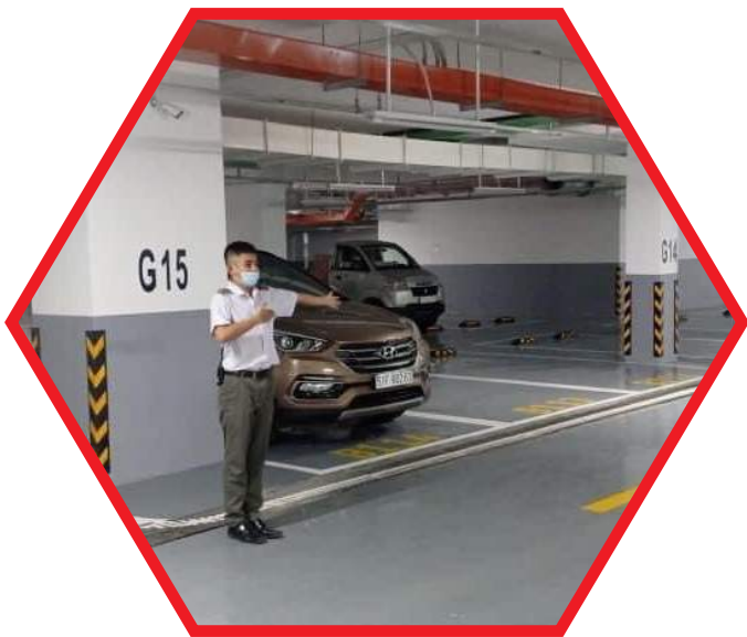
VẬN HÀNH VÀ KHAI THÁC BÃI XE CHUNG CƯ OPERATING AND OPERATING APARTMENT PARKING